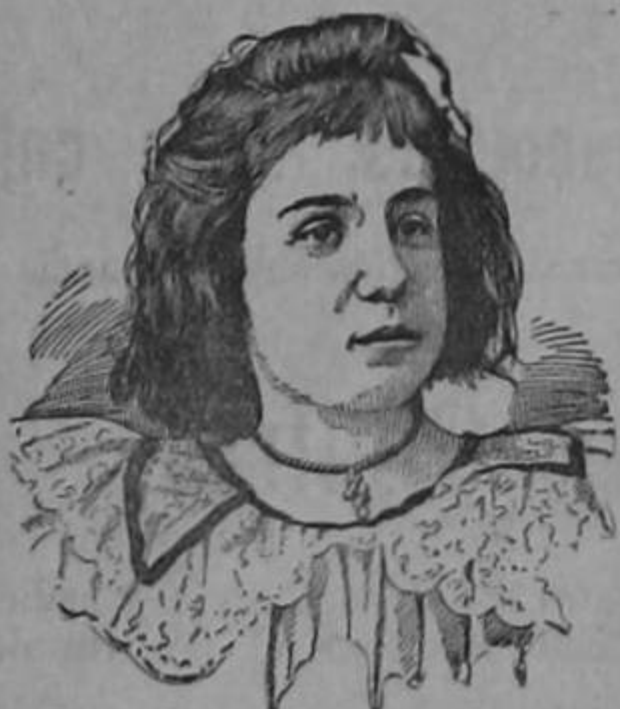
Tip. de "El Derecho"